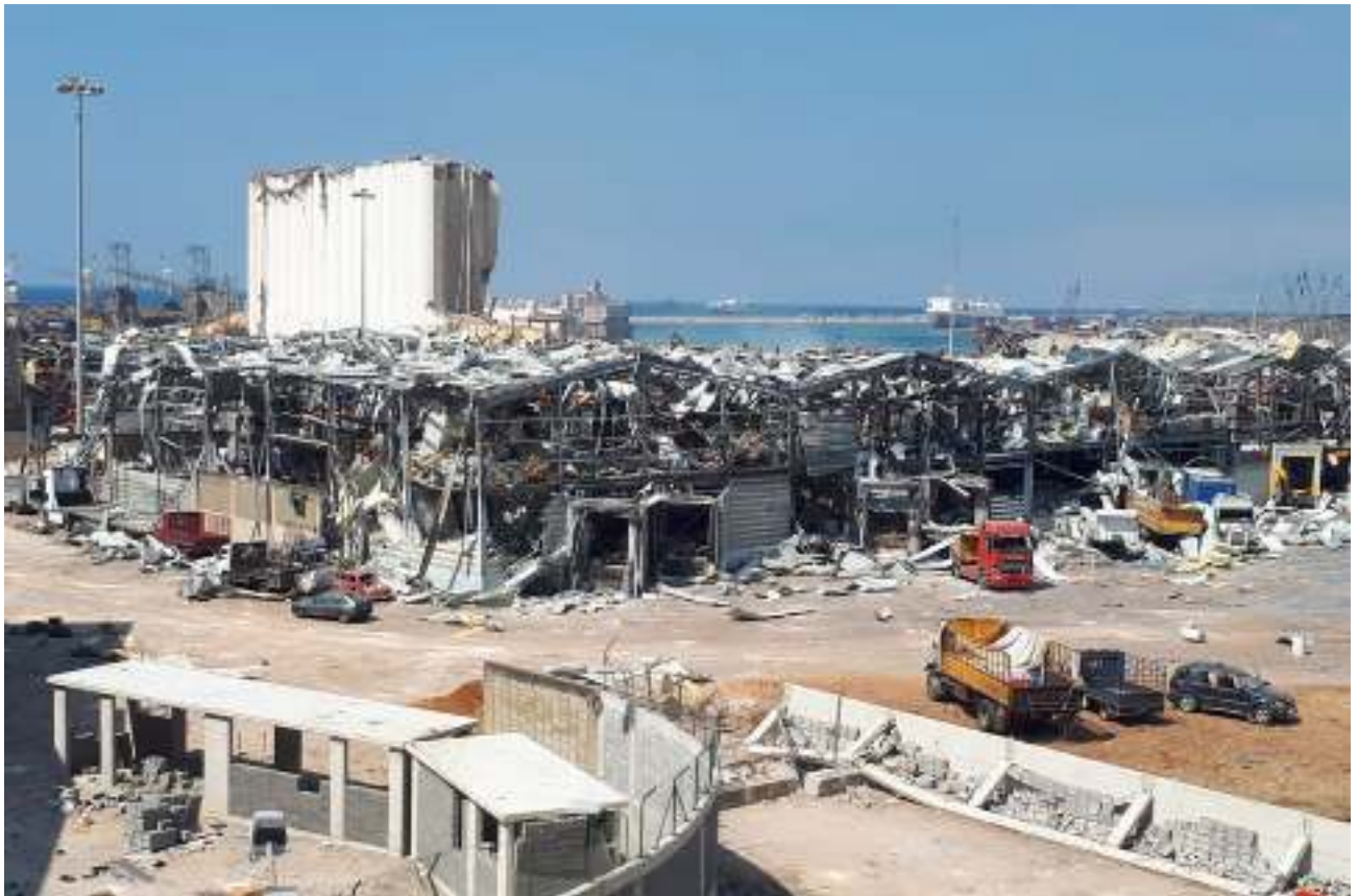
Aftermath of the hazardous cargo explosion in Beirut in August 2020.

A Memorandum of Understanding has been signed by ICHCA International, representative of global cargo handling operators, including many of the leading cargo and container terminal groups, and the International Vessel Operators Dangerous Goods Association (IVODGA), whose membership consists of the world's ocean carriers.