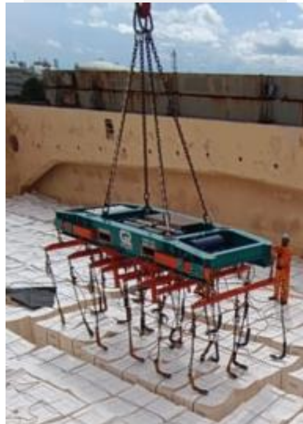
Carga: 6 x 2 unidades de pulpa por izada.

Esta edición trata sobre un incidente que destaca cómo buscar y compartir información sobre las limitaciones y particularidades de cada buque puede prevenir incidentes. Si tiene algún comentario, por favor envíenos un correo a: safety@g2ocean.com